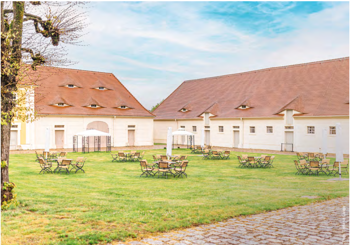
Blick in den Meierhof, der Saal befindet sich im rechten Gebäude

NUTZUNG Der Raum ist ganzjährig für Feiern nutzbar. Platzkapazität: 90 Personen in Bankettbestuhlung. Bei abweichenden Bestuhlungswünschen fällt eine Umbaupauschale an.