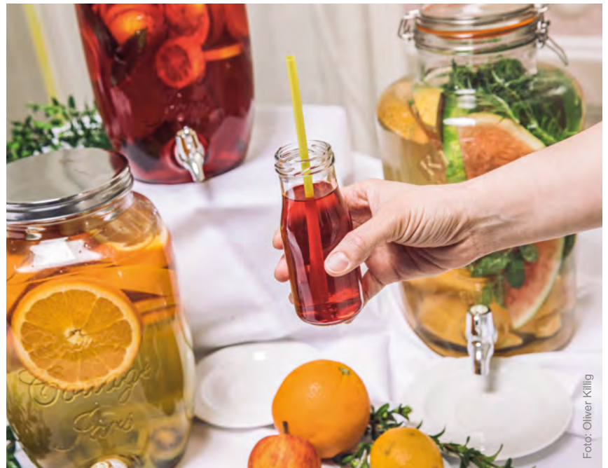
Beispiel für die Hochzeitstorte | Liebevoll zusammengestelltes Limonadenbuffet aus dem Schlosscafé