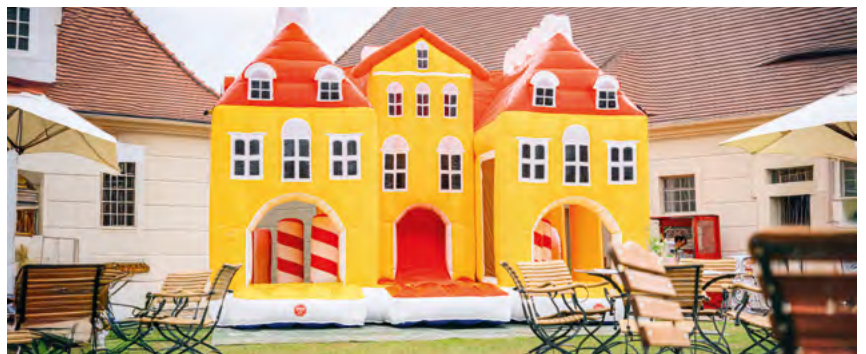
Eine Museumsmitarbeiterin bei einer Führung im historischen Gewand | Blick in einen Ausstellungsraum im Kavaliershaus | Das große »Hüpfschloss Rammenau« für Ihre kleinen Gäste