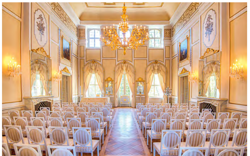
Spiegelsaal mit Reihenbestuhlung