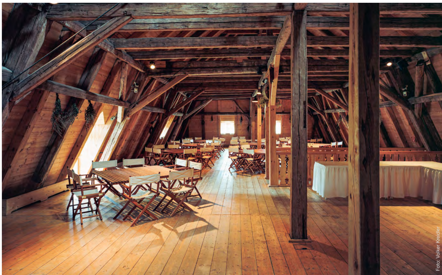
Kavaliershausboden mit Standardmobiliar

NUTZUNG Der Raum ist ganzjährig für Feiern nutzbar. Platzkapazität: 100 Personen in Bankettbestuhlung