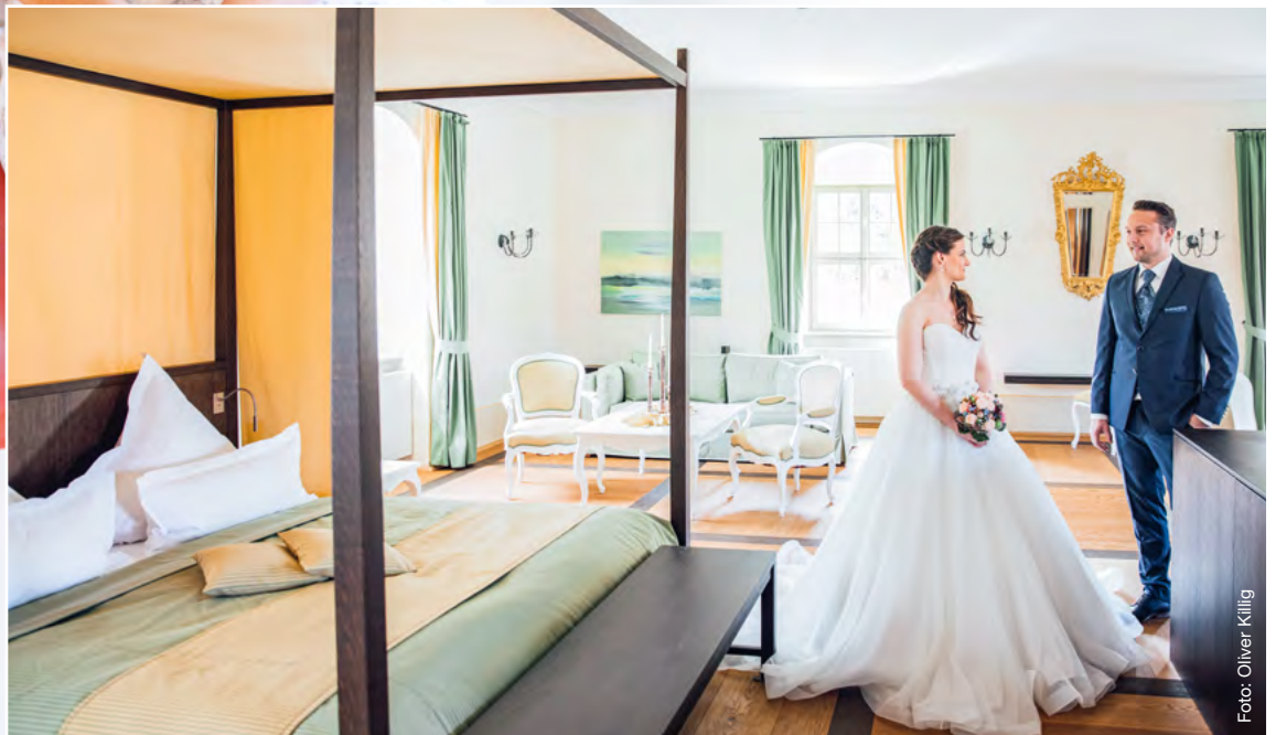
Blick in unsere Suite, wo Sie sich in Ruhe stylen lassen und auch die Hochzeitsnacht verbringen können

Wie wäre es mit einem schönen Frühstück am Tag nach der Hochzeit? Entweder nur für Sie beide, oder auch gemeinsam mit Ihren Gästen. Sprechen Sie uns an! Wir bieten sowohl Early-Check-In als auch Late-Check-Out an.