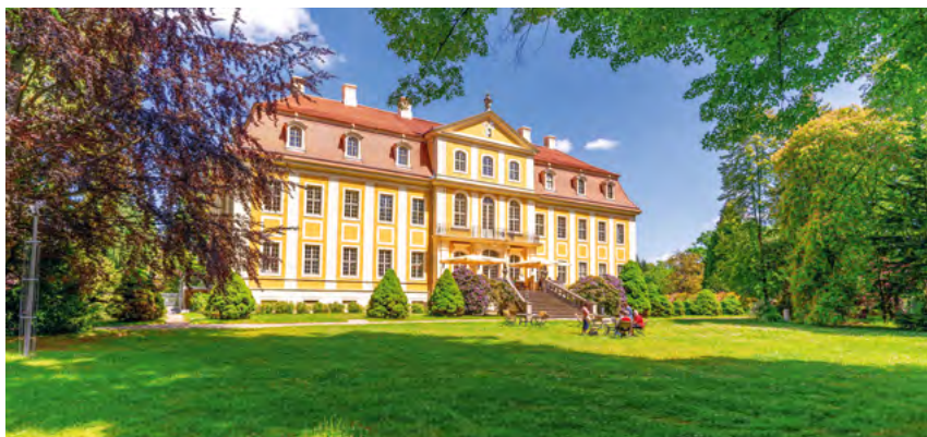
Rosenzimmer | Pavillon am Schlossteich | Schlossansicht vom Park aus