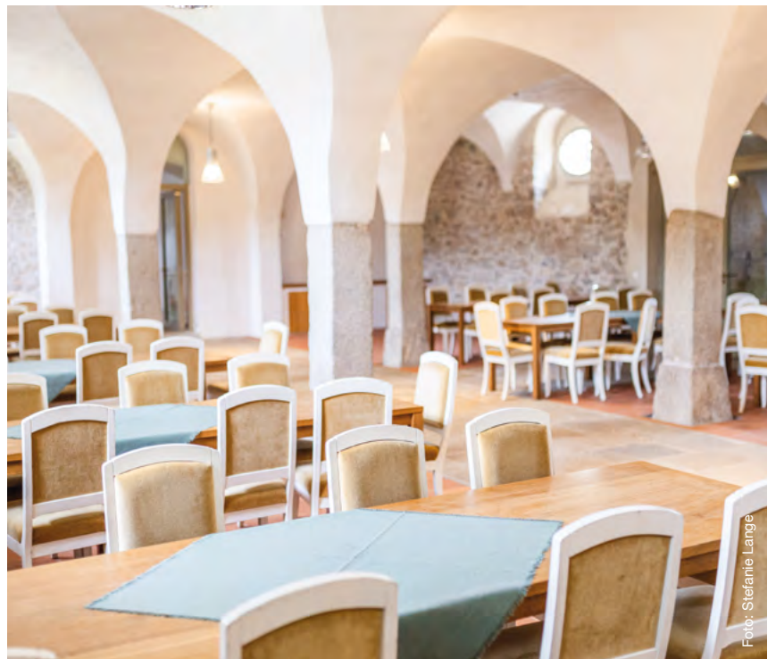
Saal im Meierhof, festlich dekoriert | Blick vom Schloss in den Meierhof | historische Details | Meierhof mit Standardbestuhlung