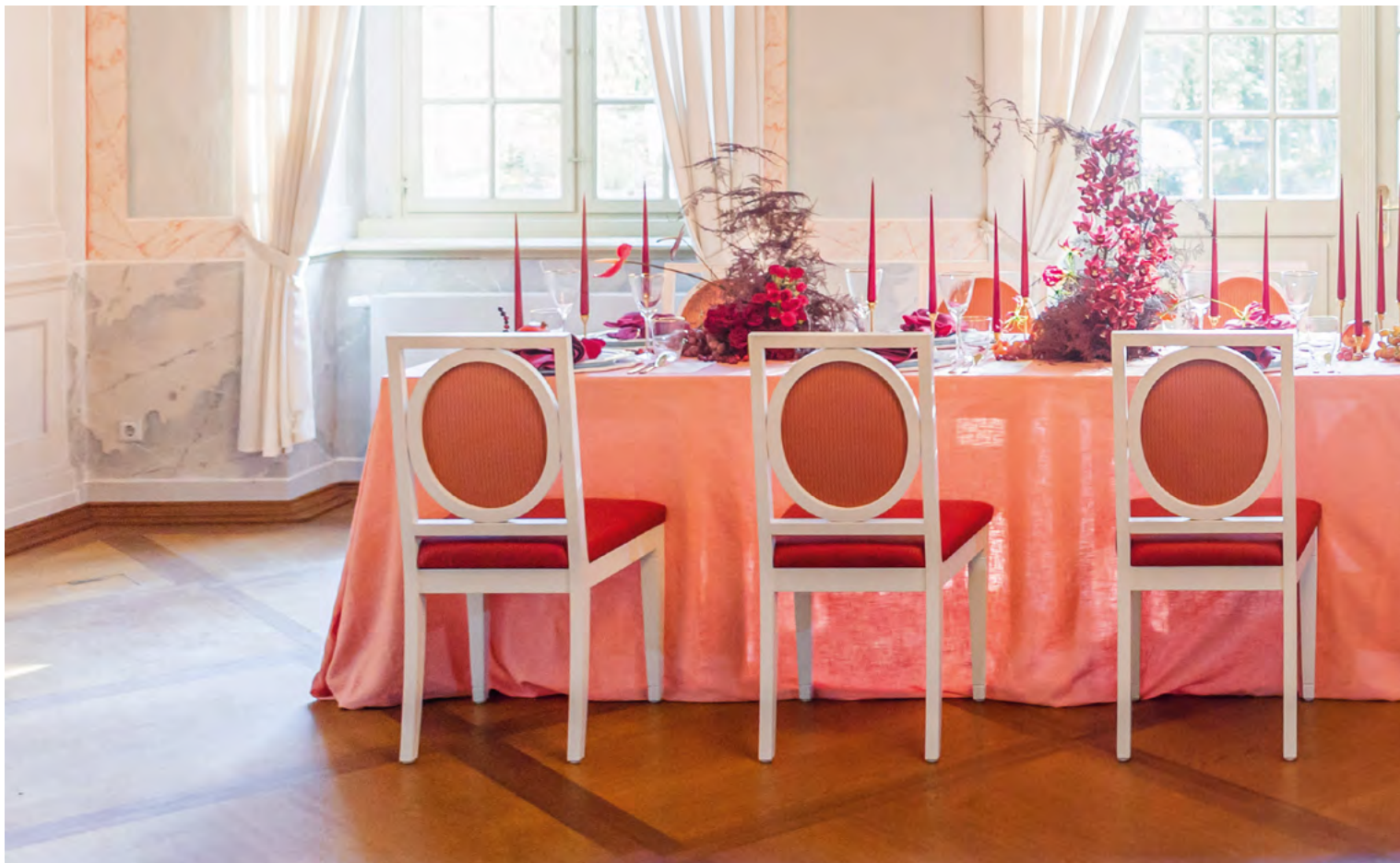
Gartensaal mit festlich gedeckter Tafel

Bei einer Feier können zudem auch die angrenzenden Räume der unteren Schlossetage, der Jagdsalon, das Vogelzimmer und das Kornblumenzimmer gemietet werden. Wir empfehlen, den Sektempfang auf der Terrasse zu genießen. Der Gartensaal eignet sich perfekt zum Essen. Im Jagdsalon oder im Vogelzimmer kann getanzt werden.