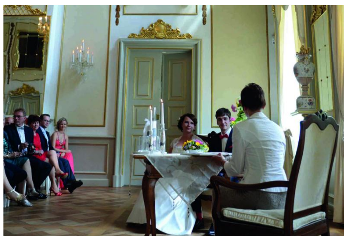
Trauung im Spiegelsaal