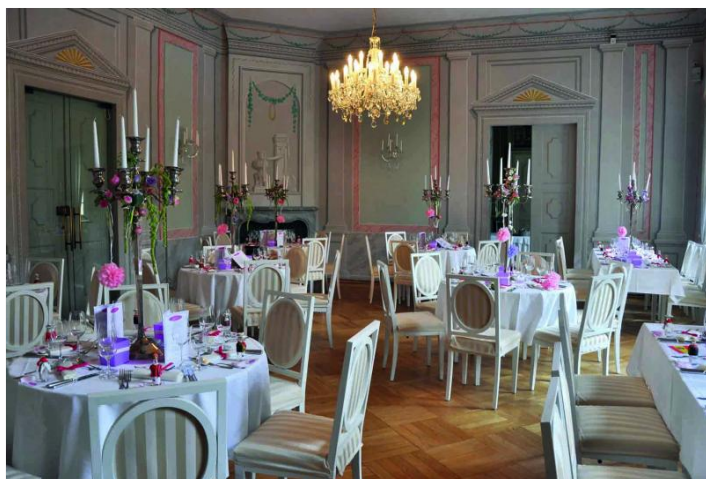
Gartensaal mit Bankettbestuhlung

1.000,00 € in Kombination mit Jagdsalon und Vogelzimmer