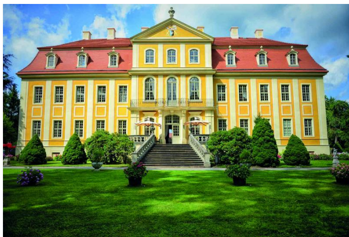
Blick aus dem Schlosspark

1.300,00 € in Kombination mit Jagdsalon, Gartensaal und Vogelzimmer