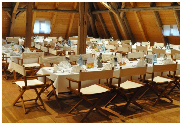
Kavaliershausboden mit Bankettbestuhlung