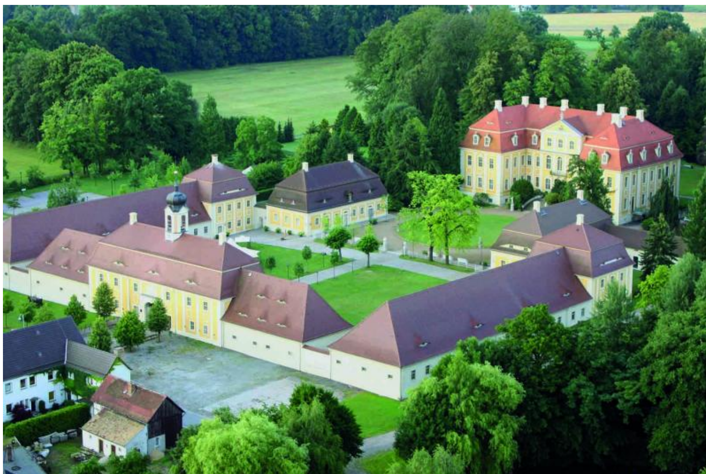
Landbarockanlage aus der Luft