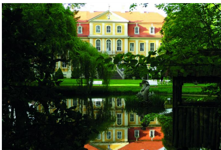
Blick vom Schlossteich

1.000,00 € in Kombination mit Gartensaal und Jagdsalon