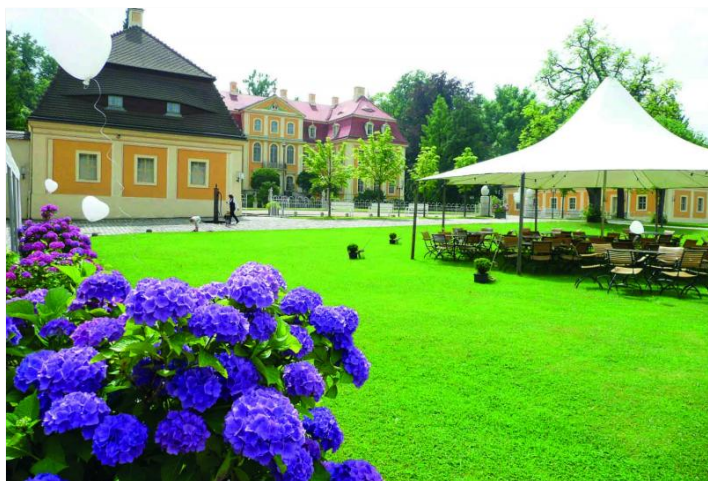
Blick vom Meierhof