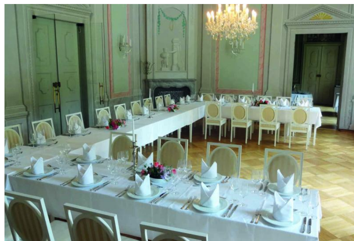
Gartensaal mit Tafelbestuhlung