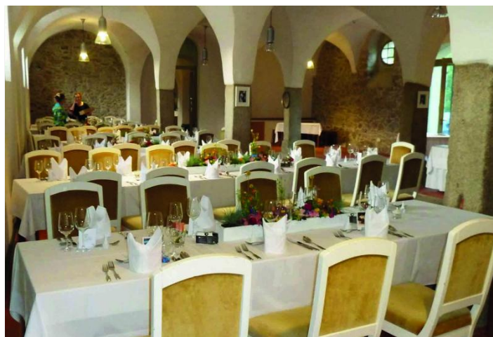
Meierhof mit Bankettbestuhlung