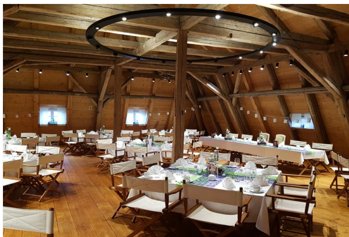
Kavaliershausboden mit Bankettbestuhlung